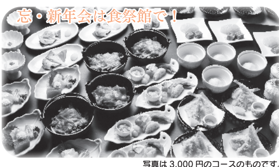
写真は3,000円のコースのものです。